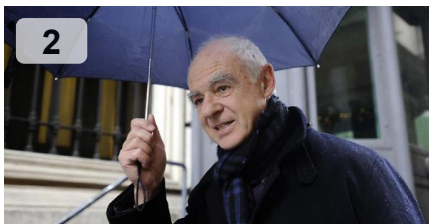
2 Luca Ricolfi su Giorgia Meloni: "Più rassicurante di Salvini. La Lega ha bisogno di lei per sfondare il 30%"

"Questo incontro precede altri due grandi eventi che toccheranno tematiche simili: 'L'economia di Francesco', che si svolgerà ad Assisi nel mese di marzo, e il 'Patto educativo globale', che avrà il suo culmine a maggio".